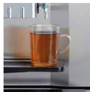
+ Sortie séparée pour l'eau chaude