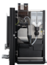
OB 3 (XL) NG