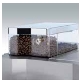
+ Des grains de café frais