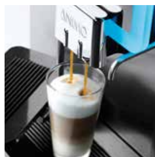
+ De nombreuses variétés de boissons, comme le Latte Macchiato