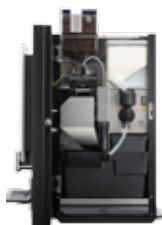
OB 2 (XL) NG